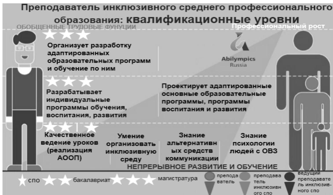
Рисунок 1. Квалификационные уровни подготовки преподавателя инклюзивного среднего профессионального образования через систему группового наставничества