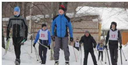
Спортивные мероприятия АО «ИМЗ»