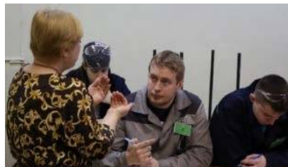
Конкурс профессионального мастерства АО «ИМЗ»