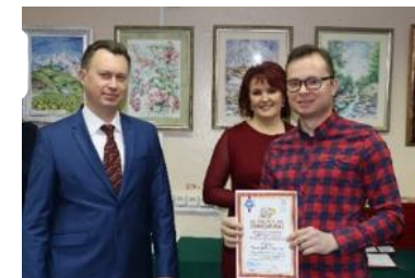
Конкурс творческих работ «Золотой штихель» АО «ИМЗ»