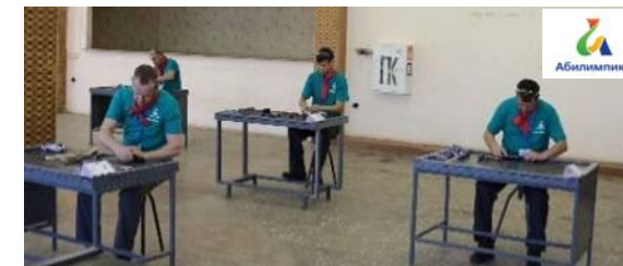
II Региональный чемпионат «Абилимпикс – 2018»